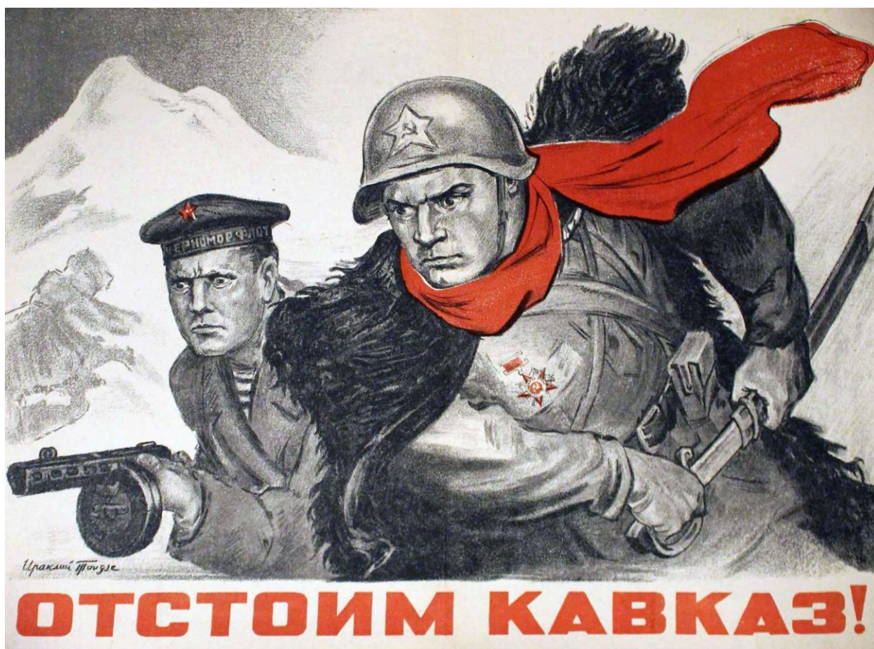
Ираклий Тоидзе. Отстоим Кавказ! 1942 г.

День пройдет, решительным ударом В бой пойдет народ в последний раз. И тогда мы скажем, что не даром Мы стояли насмерть за Кавказ.