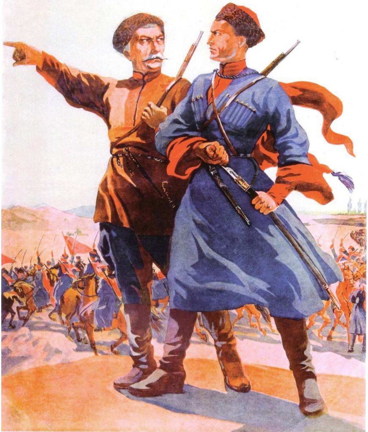
М. Маризе. На защиту Отечества! 1941 г.