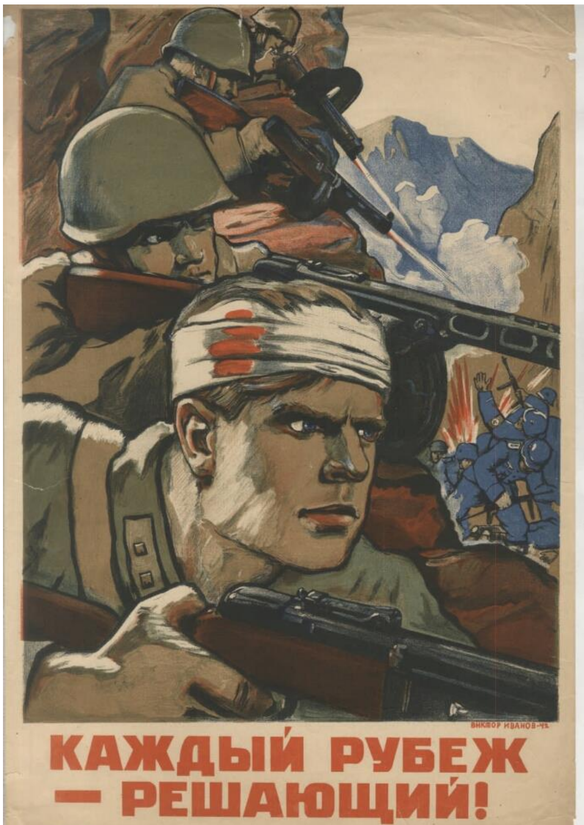
В. С. Иванов. Каждый рубеж – решающий! 1942 г.