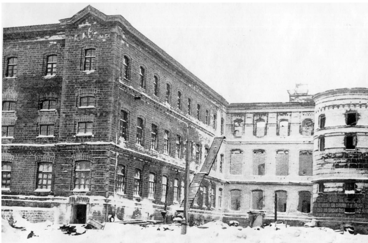
Разрушенное здание Сельскохозяйственного института.

Воспоминания автора статьи о годах войны.