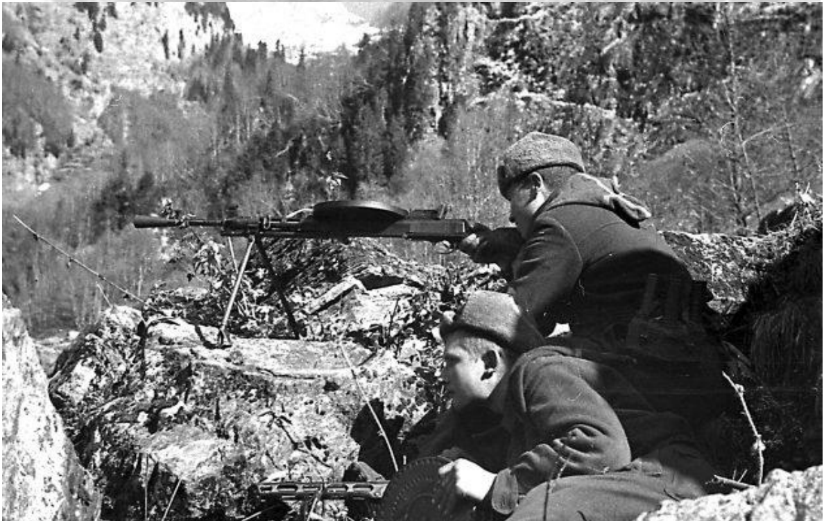
Фотохроники боев за Кавказ

Сжимая сталь озябшими руками, Вы здесь вели последний смертный бой, И в том бою не прятались за камни, А камни прикрывали вы собой.