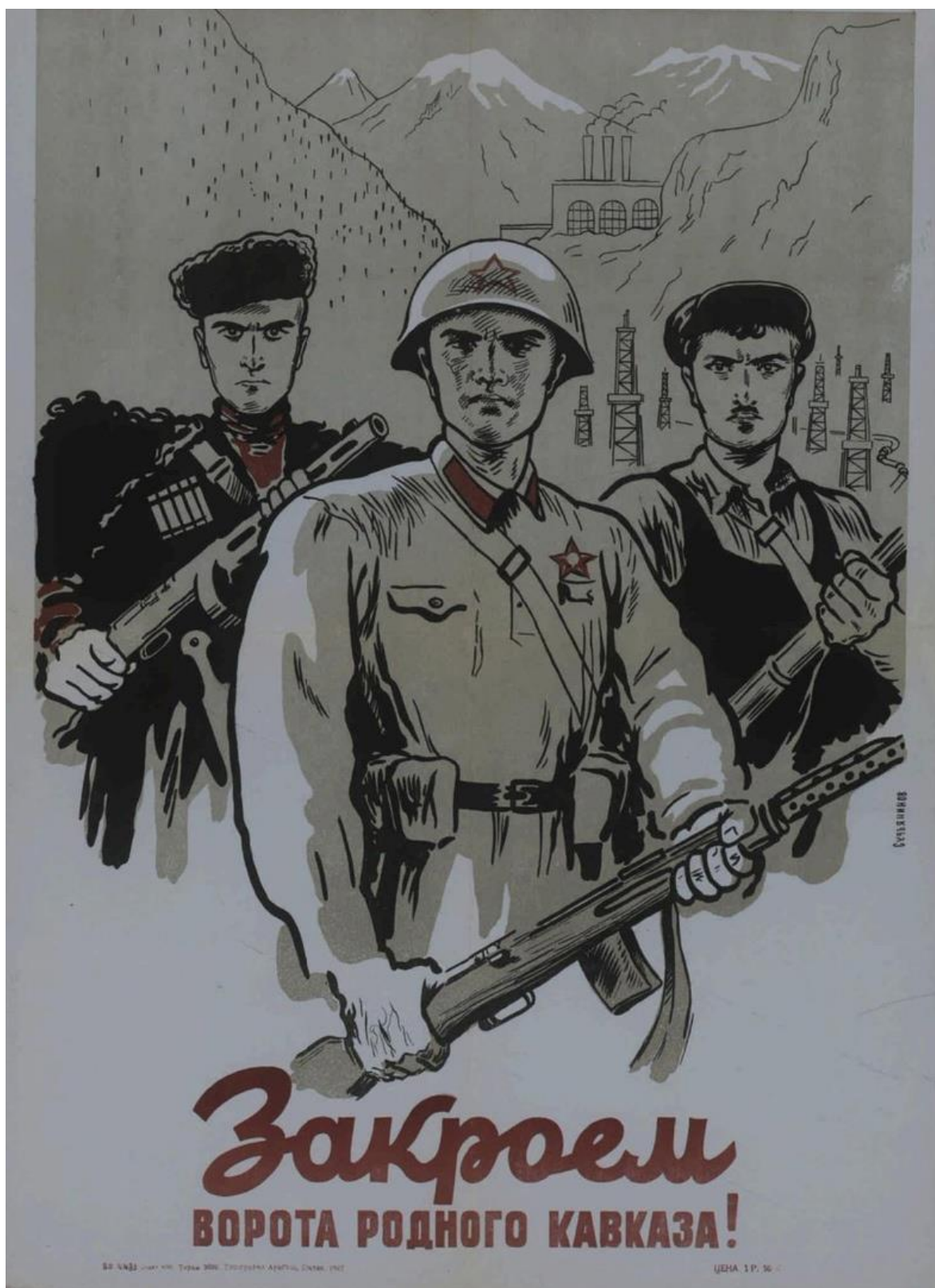
В. В. Сурьянинов. Закроем ворота родного Кавказа! 1942 г.