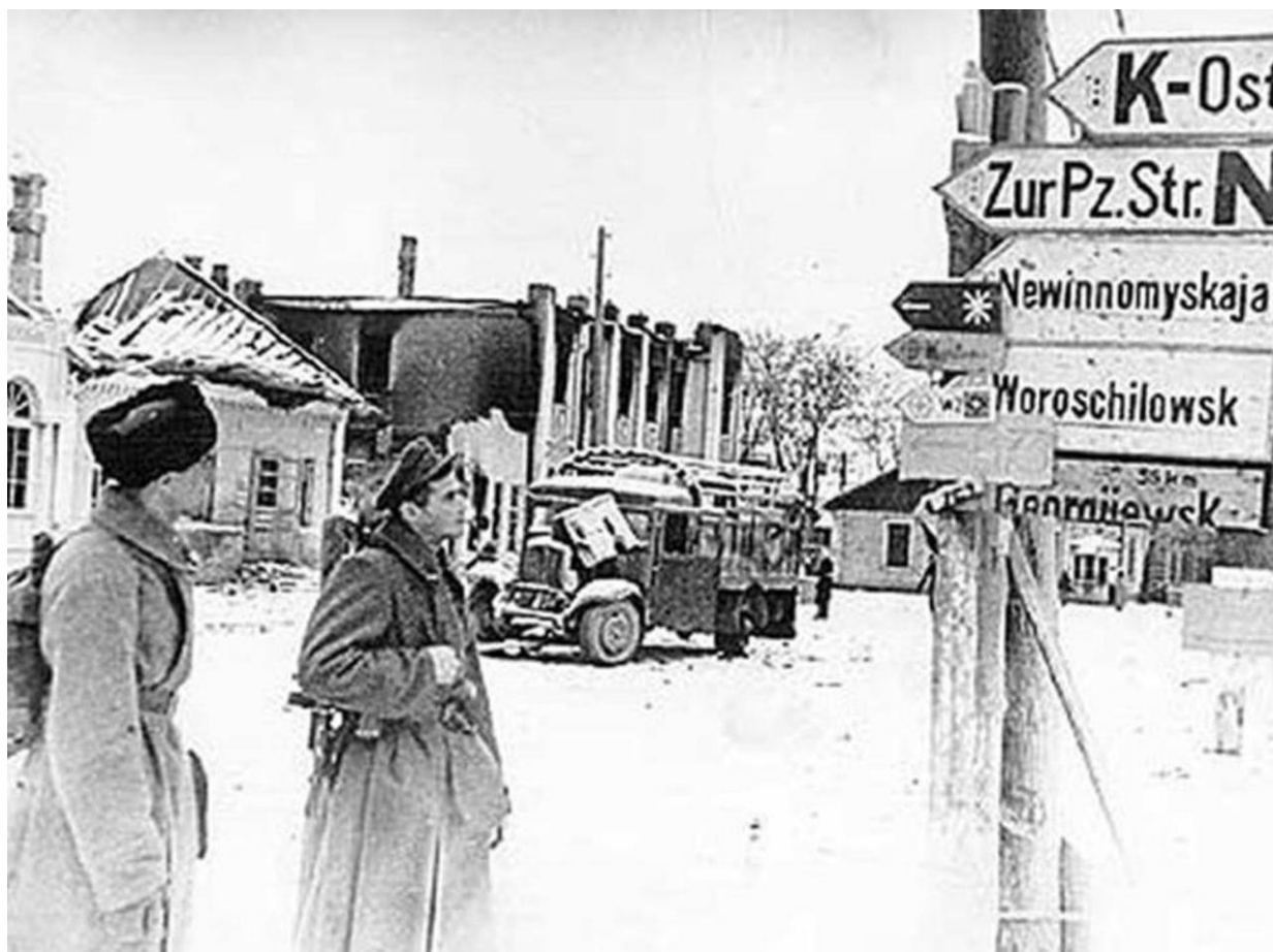
Советские воины в освобожденном Ставрополе. Январь 1943 г.