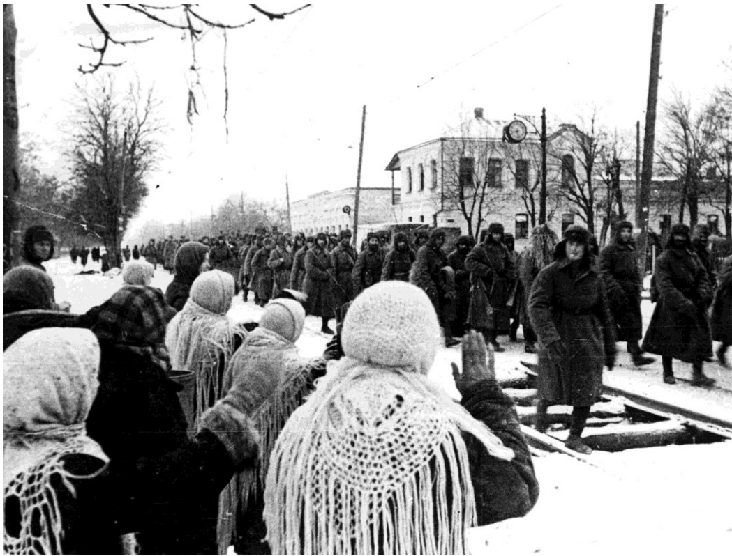
Освободители на улицах Пятигорска 11 января 1943 г.