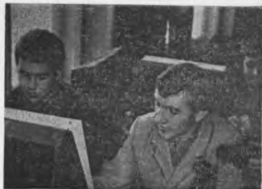
Здесь изучают студенты правила уличного движения.