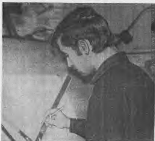
Черчение — язык техники. Тот, кто избрал себе специальность инженера-механика, хорошо знает, что успешно овладевает этим языком только упорный, терпеливый, настойчивый. Этот снимок сделан фотокорреспондентом Валентиной БОЧАРОВОЙ в чертежном зале института.