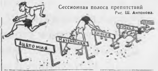
Сессийная полоса препятствий