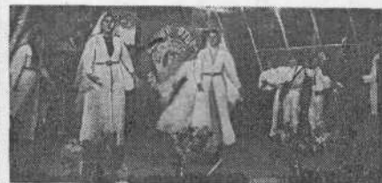
Выступает ансамбль национального танца агрофака.