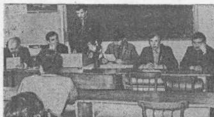
У первокурсников мехфака идет Ленинский зачет.