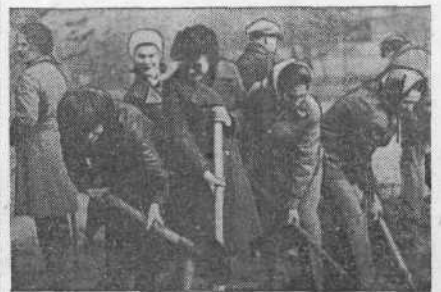
Студенты I курса факультета защиты растений на субботнике.