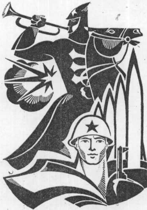
Рисунок Н. Белугина.