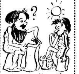
Из истории шаргалки.