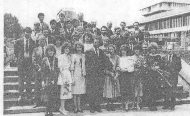
Выпускники юбилейного десятого выпуска (1989г.) работают в хозяйствах края и Черноземья.