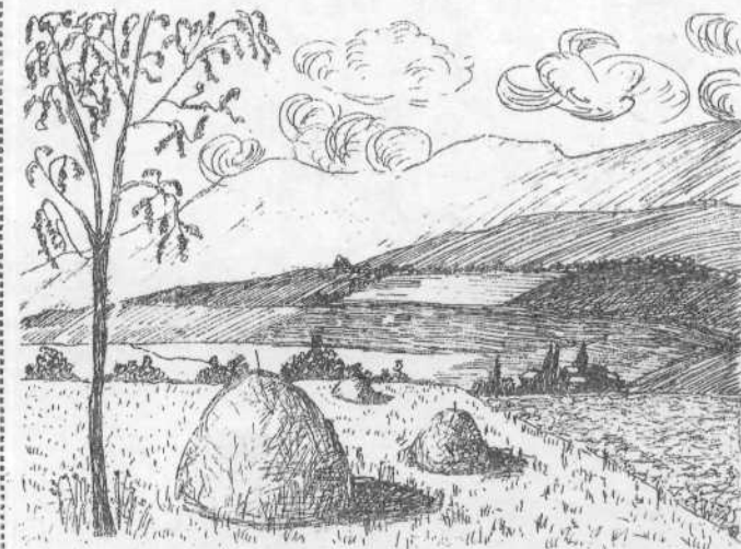
Родина мое Ставрополье