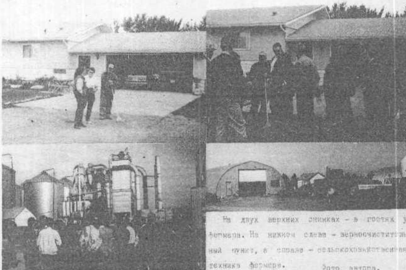
На двух верхних снимках — в гостях у фермера. На нижнем слева — зерноочистительный пункт, а справа — сельскохозяйственный техникум фермера.