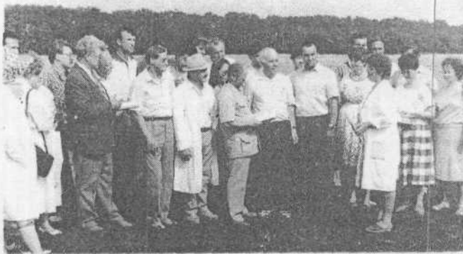
Одно из заседаний методической комиссии в поле

Методическая комиссия агрономического факультета занимается совершенствованием учебного процесса, подготовкой эрудированной, высокопрофессиональной смены аспирантов, соискателей, научных сотрудников.