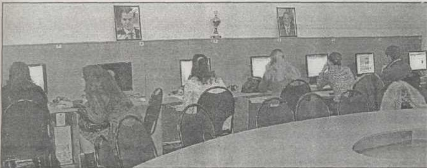
В Медиацентре всегда рабочая обстановка

Не менее сложными были следующие получение и освоение нового оборудования, большого количества учебников, пособий, научной литературы, в том числе и в электронном виде. Благодаря тому, что руководство вуза выделило новые площади, у нас появились новые отделы и центры, оборудованные современной компьютерной и множительной техникой. Для того чтобы читатели могли получить более полную информацию, мы приняли решение предоставить доступ к собственным и распределенным по всему миру библиотечным ресурсам на основе сетевых технологий.