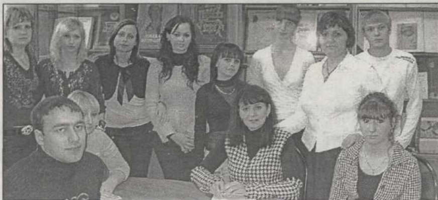
Посетители Музея редкой книги

теками мира. Немногие вузовские библиотеки могут похвастаться таким ценнейшим фондом, каким располагает Научная библиотека Ставропольского государственного аграрного университета. Редкие издания, книги XIX в. активно используются в научной и учебной деятельности университета. Теперь наиболее редкие и ценные книги нашли свое место в витринах музея, но здесь можно не только полюбоваться эксклюзивными изданиями, но и поработать с этими источниками, удобные рабочие места для посетителей с индивидуальным освещением располагают к творческой работе.